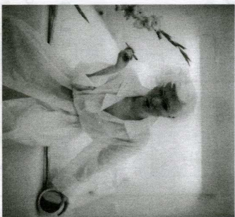
Sin título 2, 2002.

En los retratos y paisajes captados por el lente de Diana Lui esa inmigración como metáfora está repensada a partir de una poética muy personal. Lui no presenta a sus retratados con sus nombres propios. En las fichas que acompañan las imágenes de su exposición Retratos íntimos , en el Caraqueño Museo de Bellas Artes , destaca más bien la nacionalidad de sus objetos de estudio, el origen étnico de cada uno de ellos, sus sitios de residencia, a qué se dedican en lo laboral, entre otra información. Vendedores, bailarinas, fisioteras-