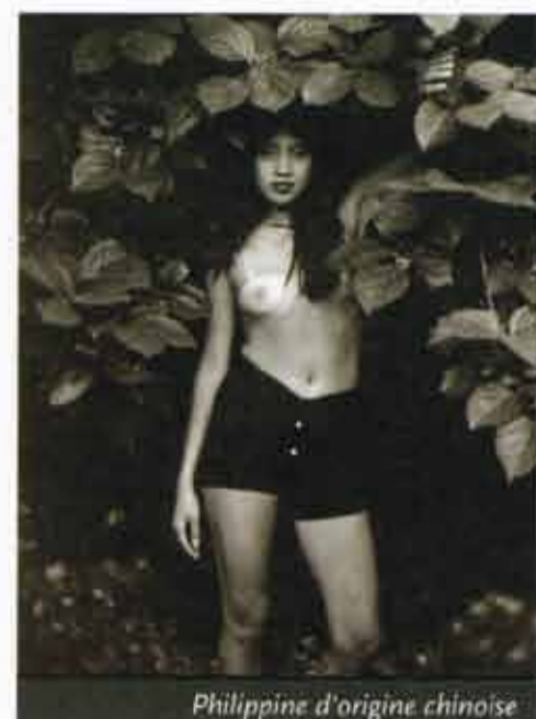
Philippine d'origine chinoise

de ses voyages. Les photographies de cette série sont exposées en grandeur nature. On sent dans son expression artistique la grande influence exercée par son enfance en Asie : les traditions familiales, les superstitions, ainsi que le mélange culturel de bouddhisme, d'islam et d'hindouisme.