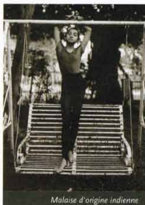
Malaise d'origine indienne